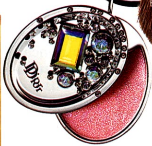
AM HALS Medaillon mit Lipgloss „Cristal Boréal 251“ von Dior, um 80 Euro (limitiert)