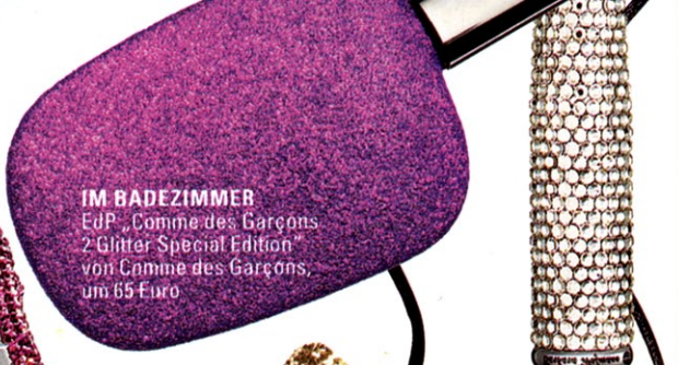
IM BADEZIMMER EdP „Comme des Garçons 2 Glitter Special Edition“ von Comme des Garçons, um 65 Euro