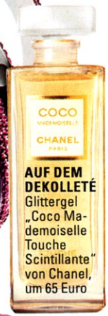
AUF DEM DEKOLLETÉ Glittergel „Coco Mademoiselle Touche Scintillante“ von Chanel, um 65 Euro