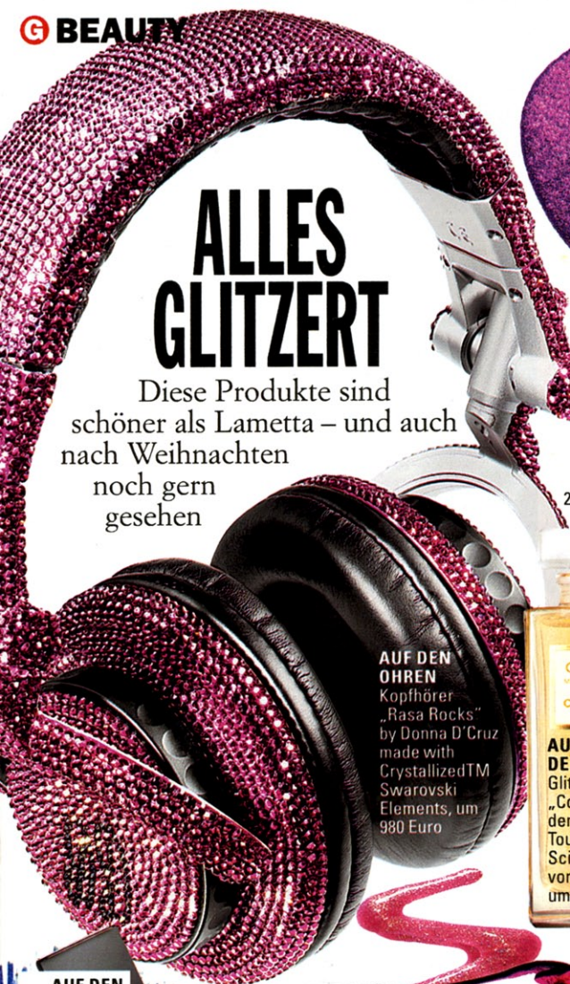
AUF DEN OHREN Kopfhörer „Rasa Rocks“ by Donna D' Cruz made with Crystallized™ Swarovski Elements, um 980 Euro

Diese Produkte sind schöner als Lametta – und auch nach Weihnachten noch gern gesehen