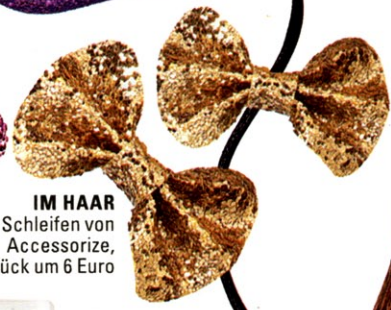
IM HAAR Schleifen von Accessorize, 2 Stück um 6 Euro